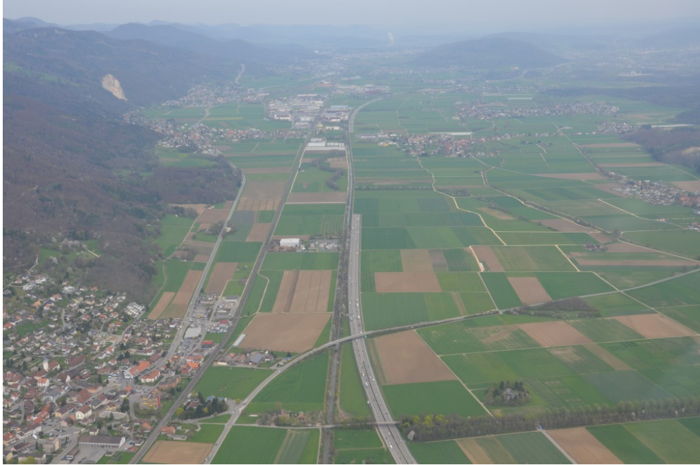
A1 bei Oensingen: Tunnelvisualisierung